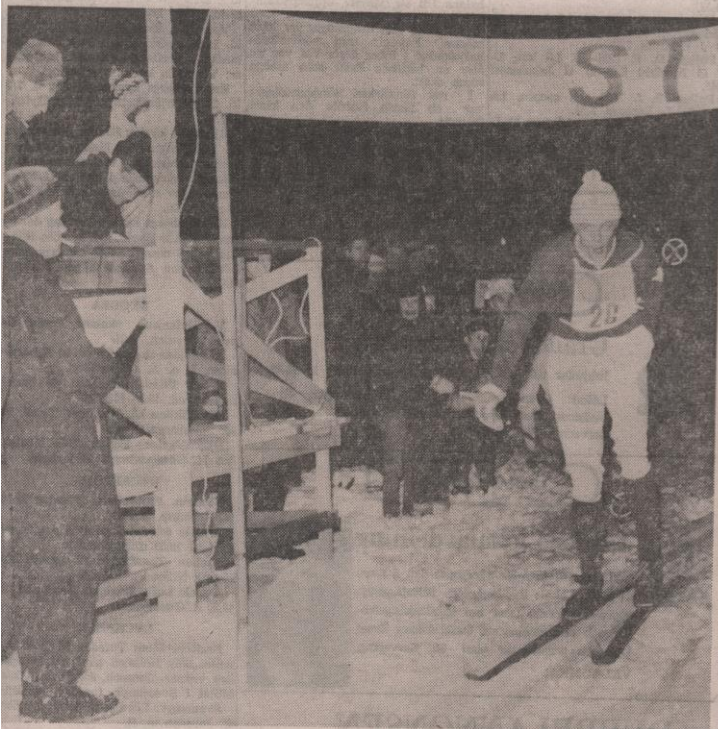
Assar i mål efter att ha vunnit alla sex "ronderna" (läs rundorna) över sina närmaste konkurrenter.