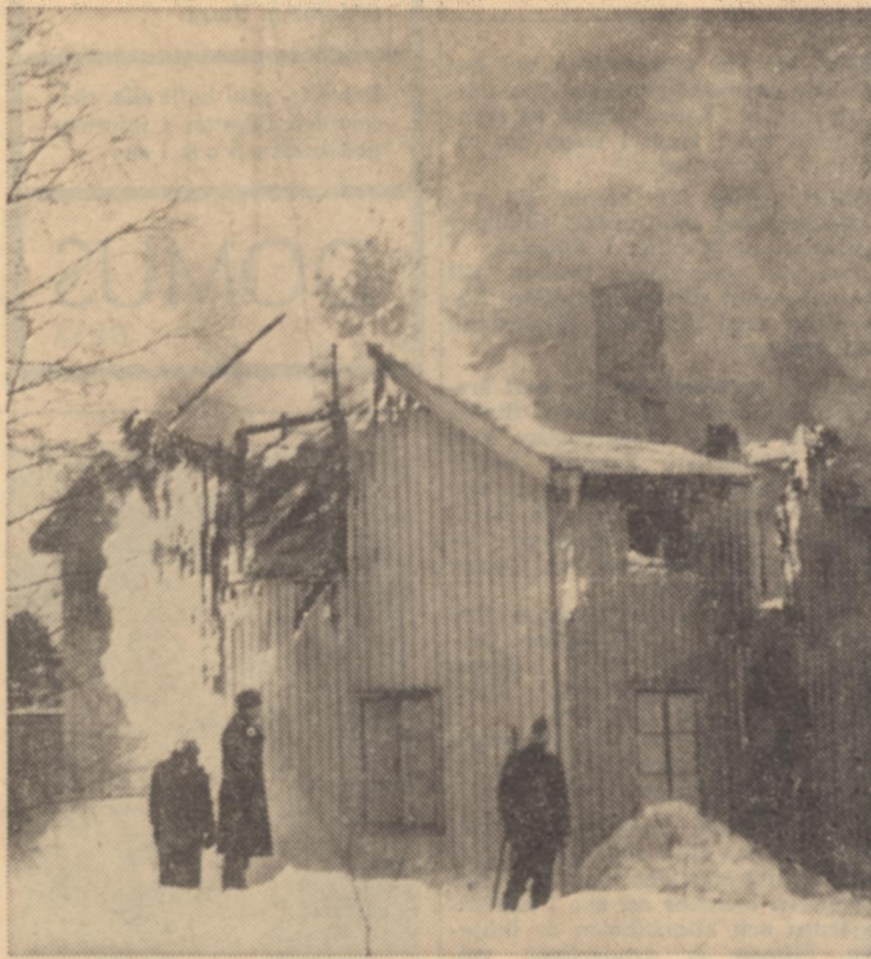
Fastigheten totalförstördes vid branden